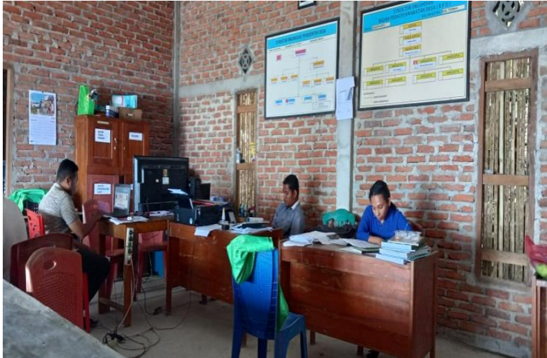
Foto Aparatur desa dalam melaksanakan pekerjaan