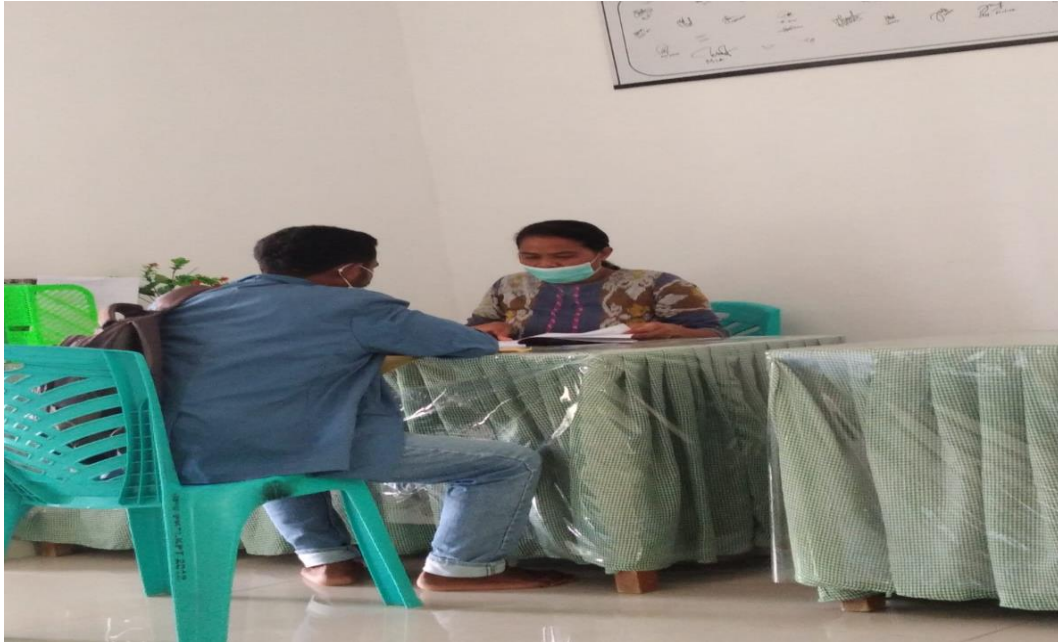
Gambar. 1.4 Wawancara masyarakat