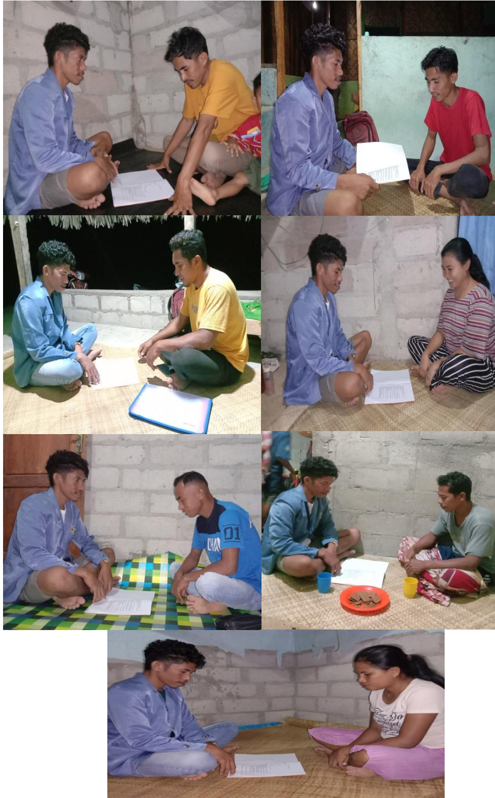
(Wawancara dengan masyarakat)