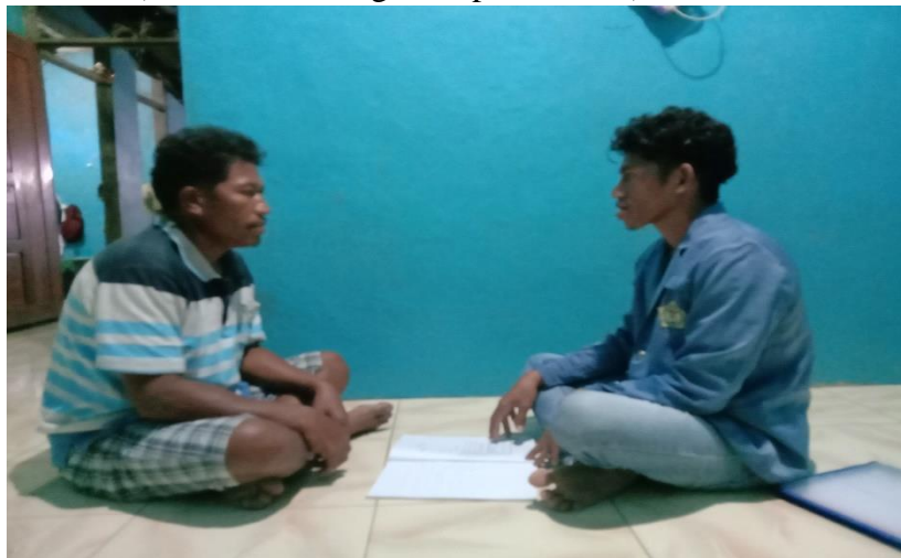
(Wawancara dengan BPD)