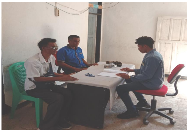
(Wawancara dengan Bapak Desa dan Sekretaris)