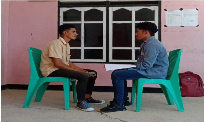
(Wawancara dengan Kepala Dusun)