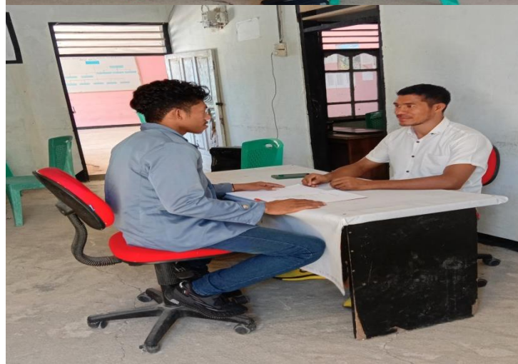
(Wawancara dengan Kaur Umum dan Bendahara)