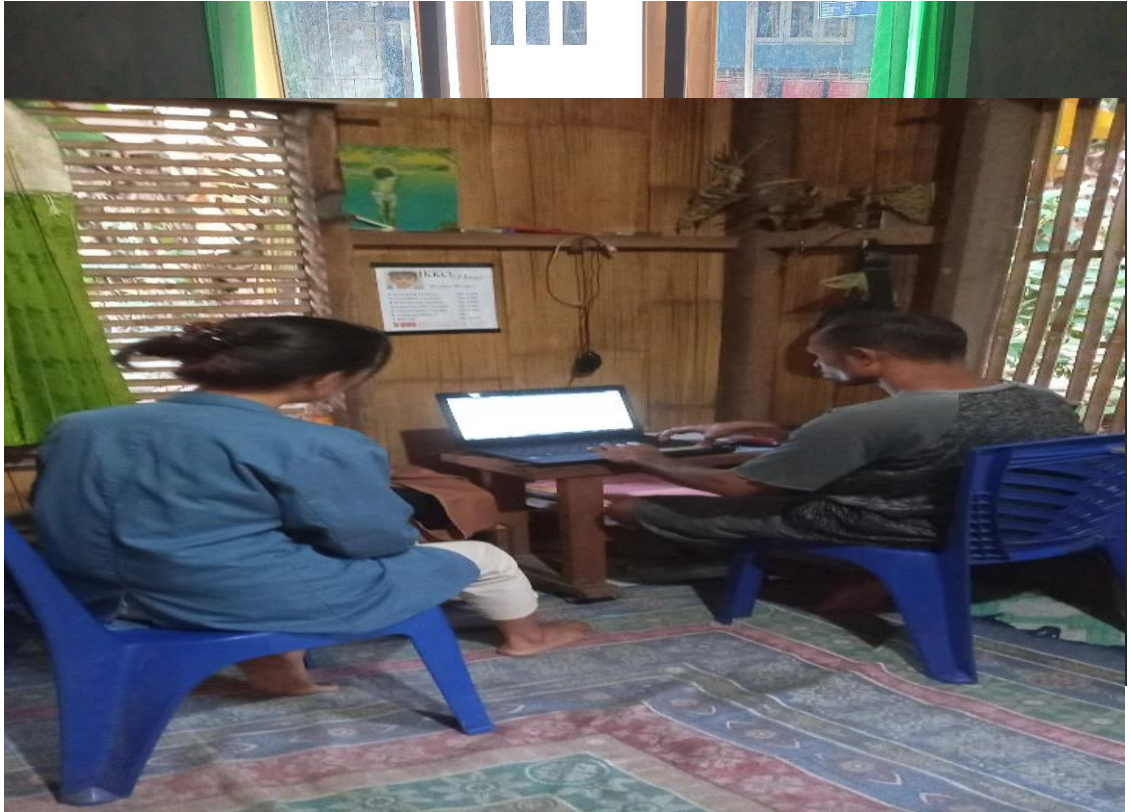
Wawancara Dengan Sekertaris Bumdes