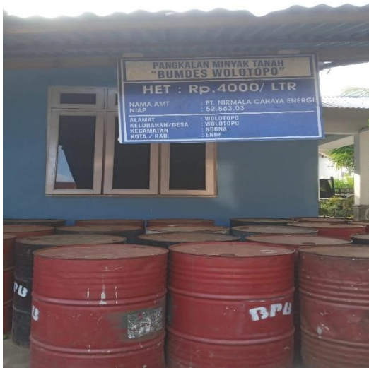
Pangkalan Minyak Tanah