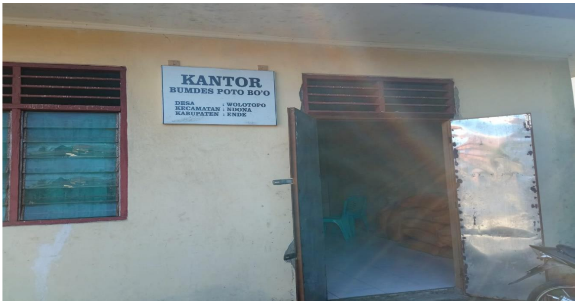
Kantor Bumdes Poto Bo'o