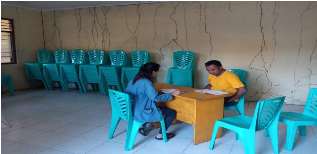
Wawancara Dengan Direktur Bumdes