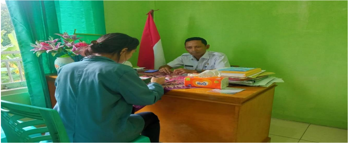
Wawancara Dengan Kepala Desa Wolotopo