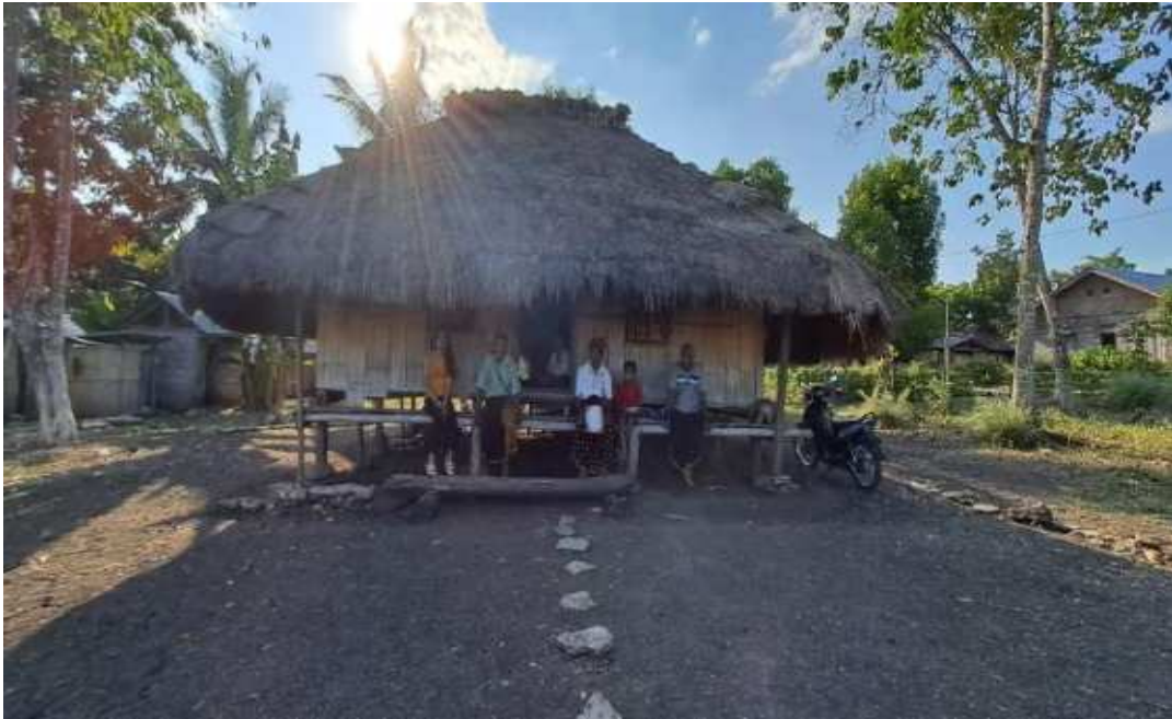
Rumah adat suku Dhere