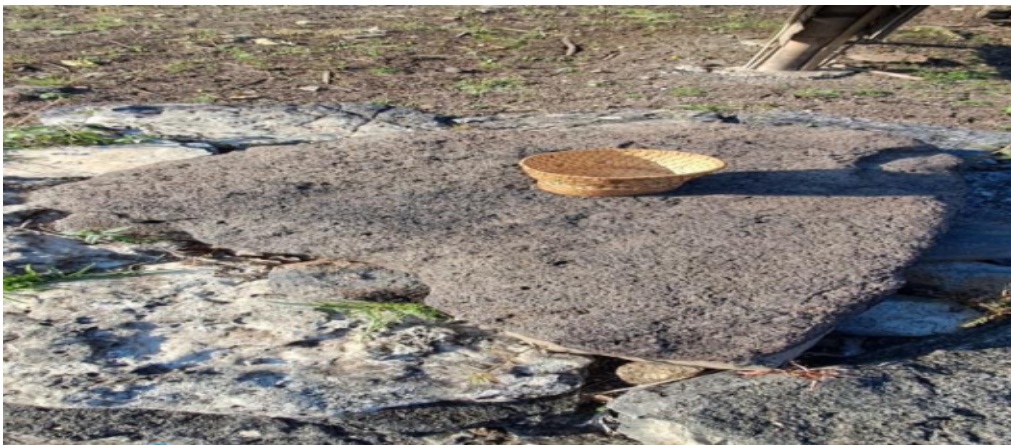
Nabe ( tempat penyimpanan sesajen)