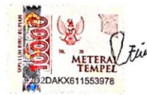
Yosefina Peni Bean