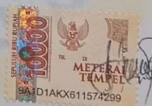
Inlezia Sonbai 43119090