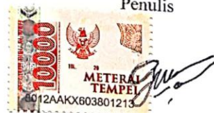
Gregorius Umbu Deta