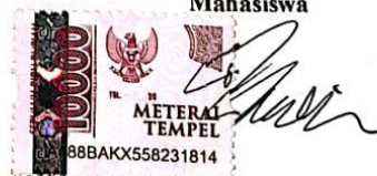
Bonefasius Ile Bahy