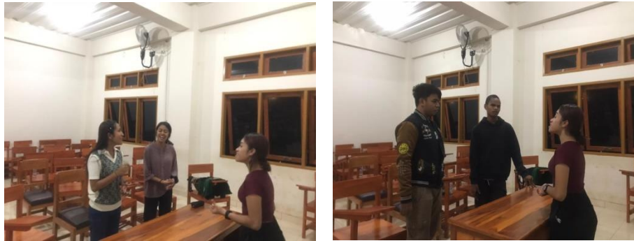
(Gambar 4.6 melatih teknik Runs)

jika sudah bisa maka mereka harus berlatih kembali menggunakan tempo yg lebih cepat.