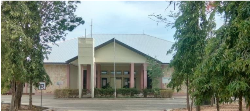
Gambar 4.5 Gedung Fakultas Ilmu Sosial & Ilmu Politik