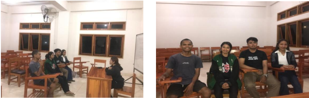
Gambar 4.8 pertemuan terakhir

dilakukannya tag vokal dan video sebagai hasil akhir dari pertemuan dan penelitian ini.