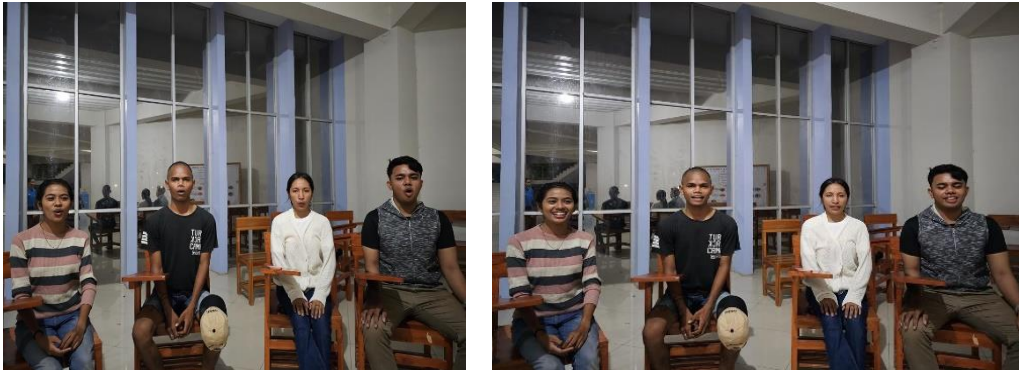
Gambar 4.2 Latihan pernapasan dan pemanasan

Pada tahap ini peneliti memberikan latihan pernapasan diafragma secara berulang-ulang dengan mengisi udara dalam diafragma lalu dihembuskan pelan-pelan saat menghembuskan nafas, keluar dengan cara bergumam, ss...ss...ss. namun secara terputus-putus, seperti menyedot udara keluar. Alasan menggunakan teknik pernapasan diafragma pada pertemuan ini karena pernapasan ini sangat cocok digunakan ketika kita sedang bernyanyi. Sebab pada teknik riff and runs ini juga sangat dibutuhkan pernapasan yang baik. setelah itu dilanjutkan dengan melatih bentuk teknik vokal dalam pengucapan huruf dengan menyuarakan A, I, E, O dengan bulat secara bergantian dari nada yang rendah hingga yang paling tinggi. Pada ini pertemuan ni berjalan lancar tidak ada kendala dan masalah dikarenakan mereka sudah terbiasa melakukan latihan pernapasan ini dll.