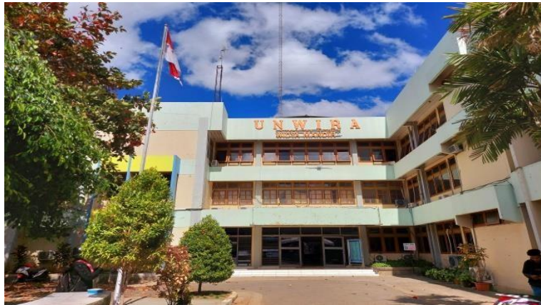
Gambar 4.2 Kampus 1 Unwira Kupang

Tata letak Kampus I dipikirkan dengan sangat baik. Sebelah timur berbatasan dengan SMKN 2 Kupang, sebelah barat berbatasan dengan SMPK dan TK St. Maria Goreti, sebelah selatan dibatasi oleh Jalan A. Yani dan sebelah utara dibatasi oleh SDK memakai Bosko dan SMPK, SMAK Giovanni. Berdasarkan rancangan masyarakat, lahan I terletak di