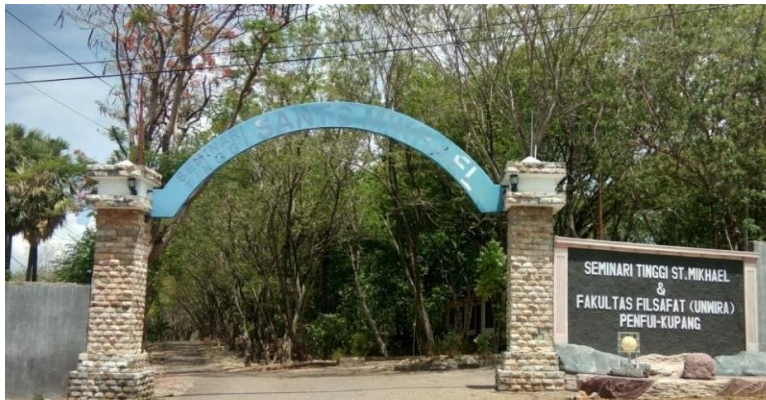
Gambar 4.8 Gedung Fakultas Filsafat Agama