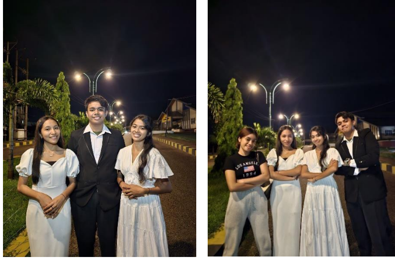
Gambar 4.9 Hasil akhir penelitian

Kupang. Kostum yang digunakan oleh anggota minat vokal ini, adalah berbaju bebas dan rapih layaknya pergi ke gereja.