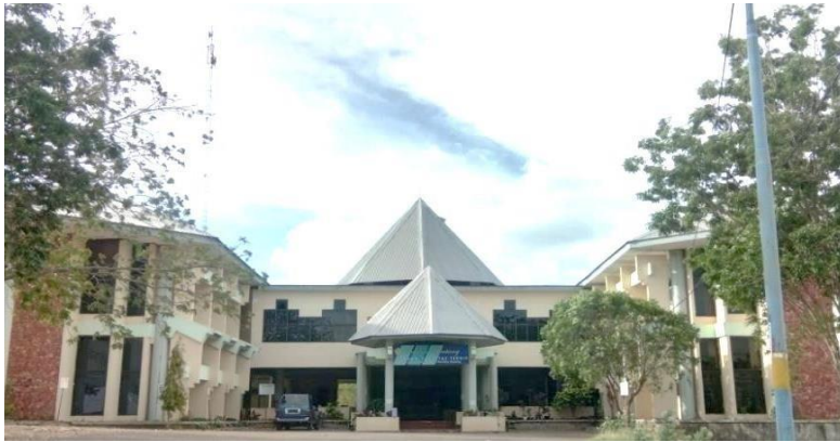
Gambar 4.7 Gedung Fakultas Teknik