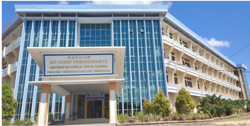
Gambar 4.4 Gedung St. Yosef Freinademetz-FKIP (Sumber : Dokumentasi pribadi Sabtu, 04 November 2023)