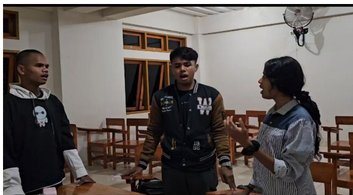
(Gambar 4.4 latihan etude riff and runs

Mereka berlatih secara gantian dan memang pada tahap ini sudah mulai nampak kemajuan dari tingkat kesulitan yang mereka alami. namun tidak begitu menyusahkan karena terlihat masih standar dan bisa untuk dilakukan.