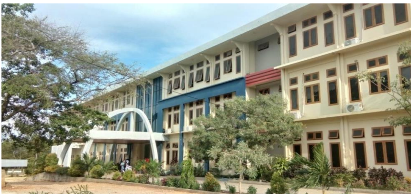
Gambar 4.6 Gedung Program Studi Ilmu Komputer