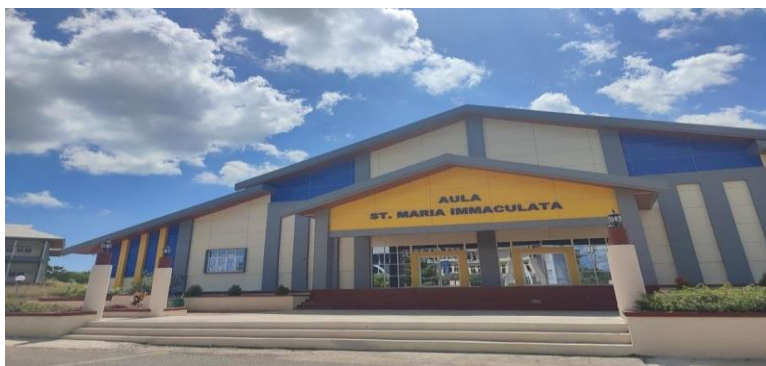
Gambar 4.9 Aula St. Maria Immaculata