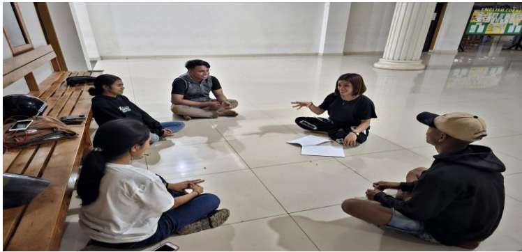
Gambar 4.1 Pertemuan perdana tahap persiapan

vokal solo untuk menjelaskan tujuan, maksud dan langkah-langkah pada penelitian ini. Kemudian peneliti menjelaskan ke bagian inti mengenai penggunaan teknik riff and runs yang akan digunakan pada lagu lagu Goodness Of God , dan mengingatkan kembali mengenai jadwal pada setiap pertemuan. Setelah itu yang terakhir peneliti memberikan alasan mengapa memilih 4 orang yang di antaranya 2 putra dan 2 putri dari semester 1 dan 5 ini.