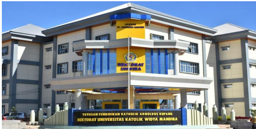
Gambar 4.3 Kampus 2 Universitas Katolik Widya Mandir

Kampus II terletak di jalan San Juan Penfui-Kupang. Lima gedung membentuk kampus ini, dan mahasiswa dari Fakultas Teknik, Fakultas Ilmu Sosial dan Ilmu Politik, Fakultas Filsafat Agama, dan Fakultas Keguruan dan Ilmu Pendidikan memanfaatkannya sebagai ruang kuliah. Ada juga 1 Sta. Maria Immaculata, yang berfungsi sebagai aula untuk berbagai keperluan.