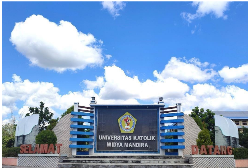
Gambar 4.1 Kampus Universitas Katolik Widya Mandira Kupang