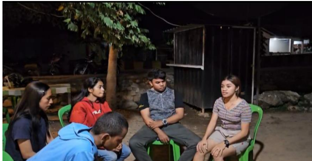
Gambar 4.7 evaluasi hasil latihan

Setelah usai latihan, peneliti memberikan arahan dan evaluasi bersama untuk membuat perbaikan. Peneliti juga mengingatkan kembali jadwal latihan yang akan dilaksanakan pada esok hari dan persiapan untuk pertemuan terakhir pada penelitian ini.