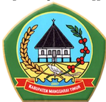
Gambar 4.2 Logo Kabupaten Manggarai Timur

Logo daerah tersebut ditampilkan dalam sebuah lukisan yang mudah dipahami yang mewakili jiwa, semangat, dan cita-cita masyarakat Manggarai Timur. Diwakili oleh perisai, rumah adat, burung lujang lawe, tangkai padi dan kopi, serta kebun masyarakat/lodok. Identitas Kabupaten Manggarai Timur diwakili oleh komunal/lodok yang mempunyai arti sebagai berikut: