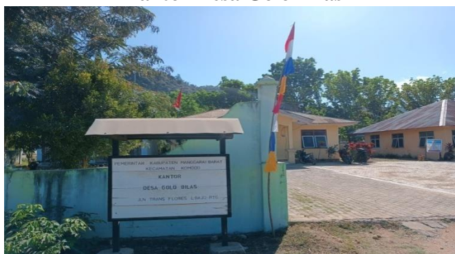
Gambar 4.1 Kantor Desa Golo Bilas