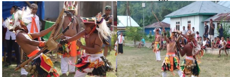
Gambar 4.2 Atraksi Tarian Caci Sanggar

dalam pengembangan wisata tematik melalui atraksi berbasis budaya masyarakat Desa Golo Bilas melakukan beberapa atraksi seperti penerimaan adat di pa'ang, ronda dari paang menuju rumah gendang, penerimaan adat di rumah gendang, tarian tiba meka (terima tamu), tarian ako woja atau mawo (tarian panen padi), tarian rangkuk alu , tarian nundu ndake , tarian caci dan tarian danding .