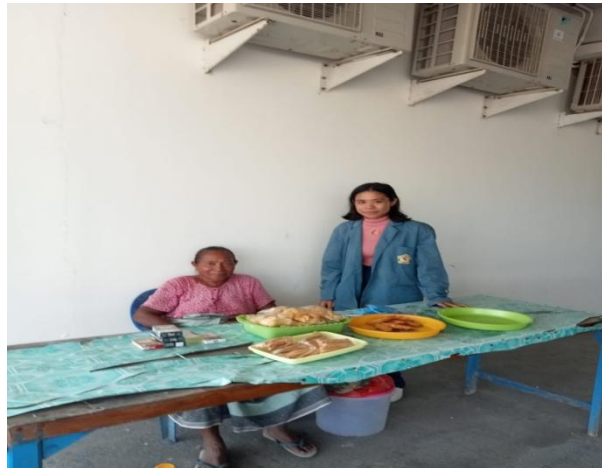
Gambar 4.5.2.2 Lapak di pasar PLBN Motamasin

Di pasar PLBN Motamasin menggunakan lapak berupa meja, ada sekitaran 15 lapak yang ada di pasar PLBN, setiap lapak menjual barang berupa kue, ikan, lontong, tahu tempe dll, dan setiap lapak retribusinya sama RP 3.000 perhari