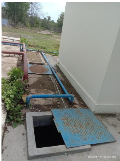
Gambar 4.5.2.7 Bak/viber penampung air di PLBN Motamasin

Di pasar PLBN Motamasin selalu menyediakan air bersih di setiap bak /viber untuk kebutuhan setiap hari dan kebutuhan di pasar PLBN Motamasin. PLBN Motamasin juga menyediakan viber di atas dan ada juga bak air cor di bawah tanah, sehingga air untuk memperoleh kebutuhan di pasar PLBN Motamasin.