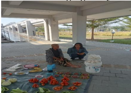
Gambar 4.5.3 Dagangan Sayuran