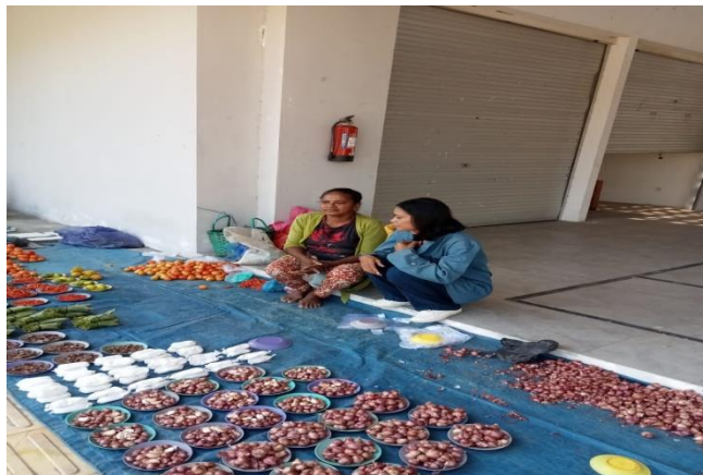
Gambar 4.5.2.1 Los di pasar PLBN Motamasin

Di pasar PLBN Motamasin banyak yang menjual barang dengan menggunakan los, agar mempermudah penjual dan pembeli, dalam berinteraksi dan memberikan rasa Nyaman, teratur rapisupaya aktivitas jual beli tidak mengganggu penjual atau pembeli yang datangnberbelanja di pasar PLBN Moatamasin.