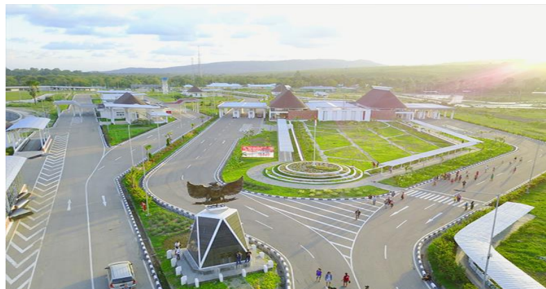
Gambar 4.3 PLBNMotamasin

PLBN terpadu Motamasin memiliki bangunan utama seluas 2.114 meter persegi, meliputi bangunan kedatangan, bangunan kantor, dan bangunan keberangkatan. Total luas bangunan mencapai 3.077.88 meter persegi yang berdiri di atas luas lahan 11.29 hektar.