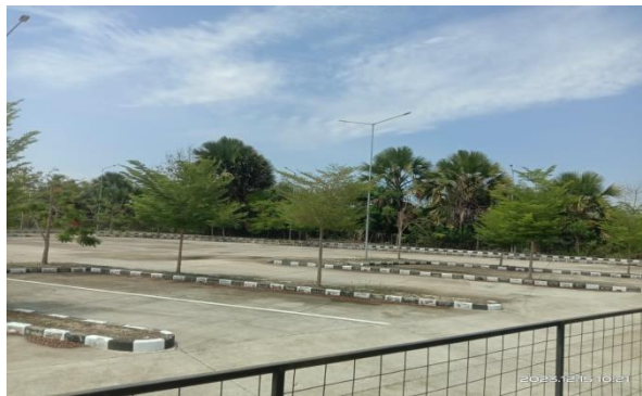
Gambar 4.5.2.5 tempat parkir PLBN Motamasin

Tempat yang bersifat sementara untuk melakukan kegiatan pada suatu kurun waktu, sehingga di pasar PLBN Motamasin menyediakan tempat parkir yang sangat luas dan aman diparkir, sehingga pemarkir tidak sembarang parkir di tempat lain.