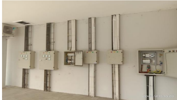
Gambar 4.5.2.6 Listrik di pasar PLBN Motamasin