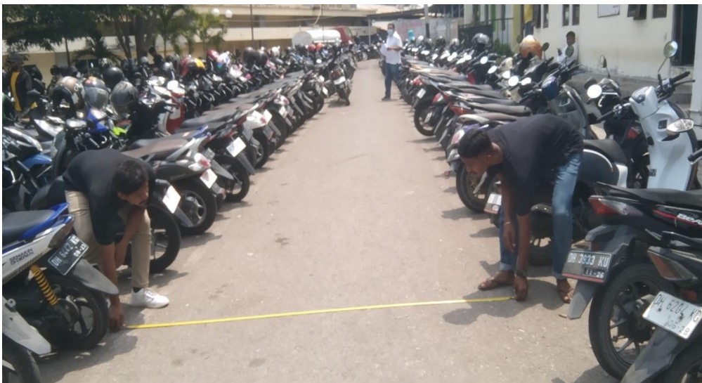
Gambar4.3. Pengukuran lokasi parkir