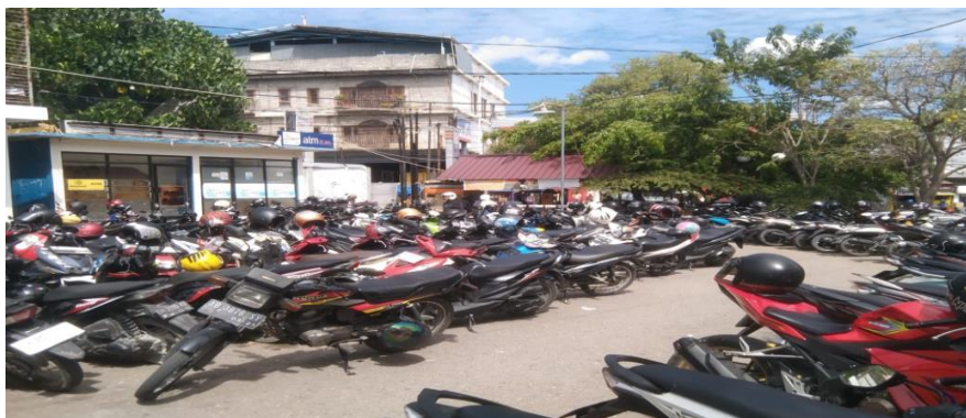
Gambar 4.1. Gambar Parkiran Mobil dan Motor