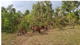
gambar 3.7 pelepasan sapi dari kandang ke ladang

Sapi dalam kandang siap di lepaskan ke ladang