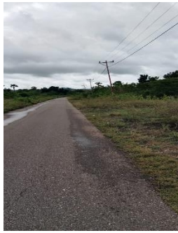
gambar 3.4 kondisi jaringan

Jaringan transportasi menuju lokasi bisa menggunakan kendaraan umum dan kendaraan pribadi.