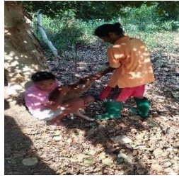
gambar 3.6 proses pemberian vitamin