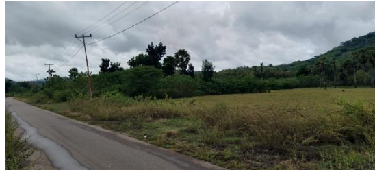
Gambar 3.2 Topografi Lokasi Perencanaan