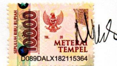
Yofita Niba Songga