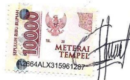
Flora Ida Hun