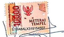
Advenia Fransiska Bewo, S.Pd

Kupang, 8 September 2024 Pembuat pernyataan