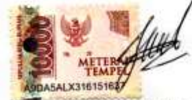
Cresensiena Reynalda Narus