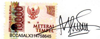
Maria Droste Tae Asa Teti