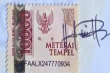
Hendriqre Humbertus 43118089