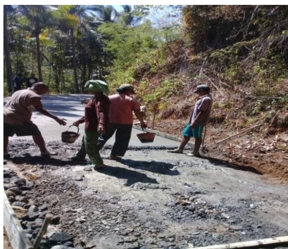
gambar 01 pembangunan rabat

Pembangunan rabat jalan di Desa Neneowea kecamatan Jerebuu.