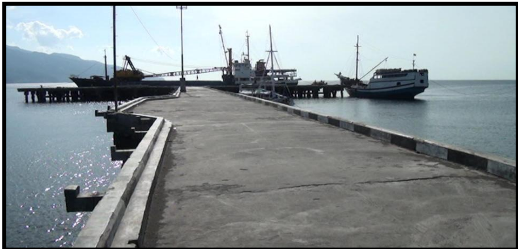
Gambar 1.2. Kondisi Pelabuhan IPPI Ende