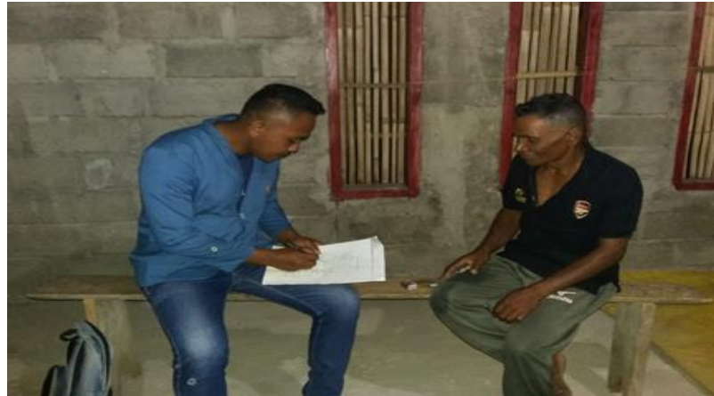
Sumber: Hasil Dokumentasi Penulis