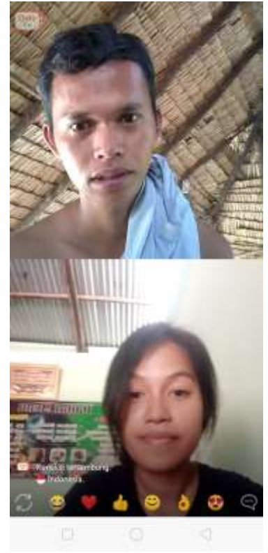
17 Mei 2022