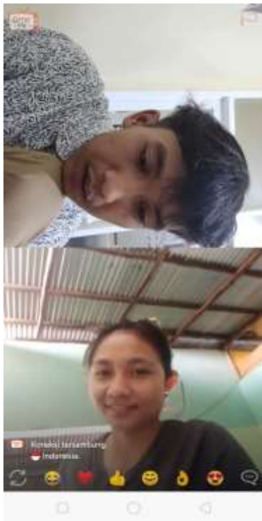
18 Mei 2022